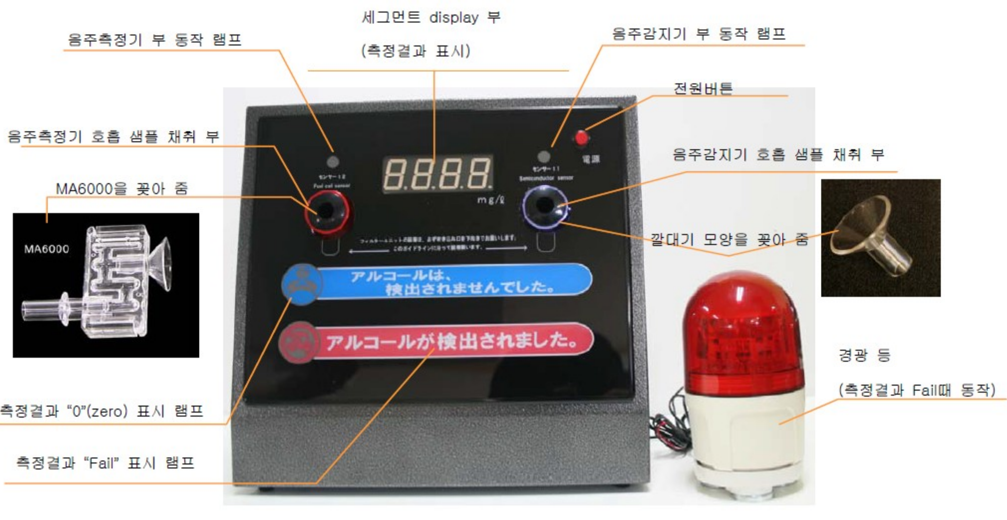
전 면 부