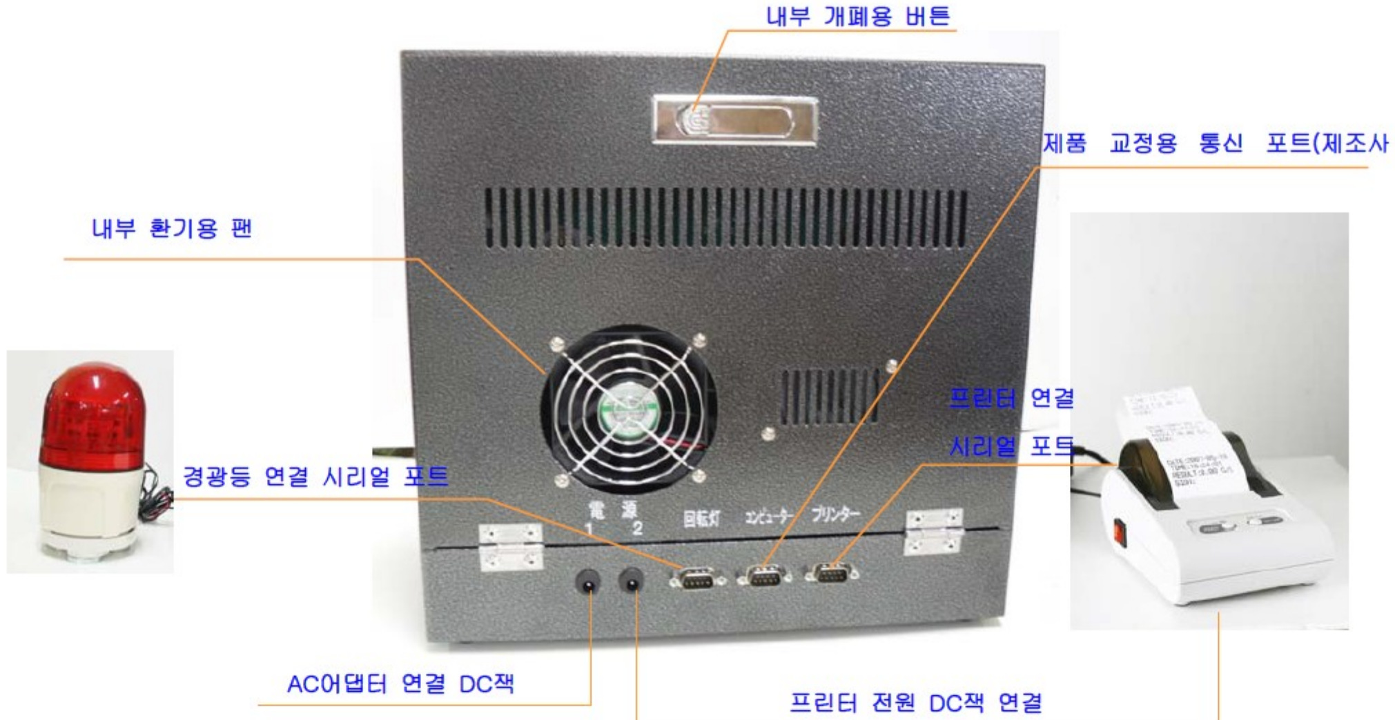
후 면 부